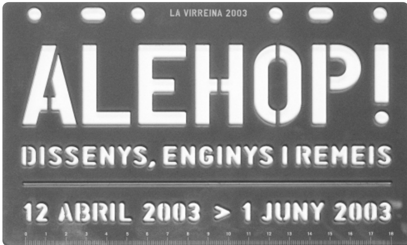
Andreu Balius Postal para la exposición Alehop! 2003

Postal que sirve para anunciar una exposición pero que puede utilizarse como regla o para jugar a componer el título de la muestra.