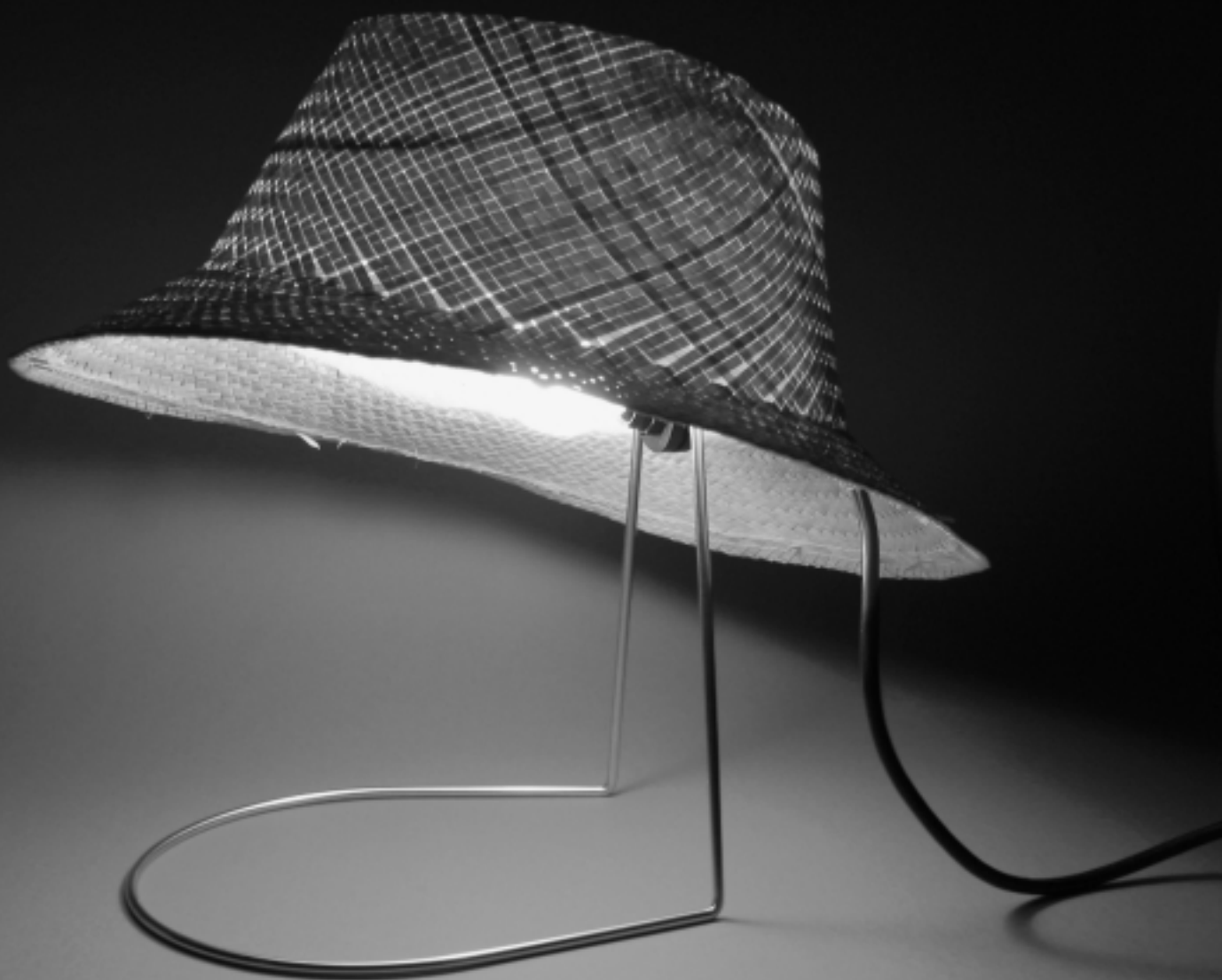
Curro Claret "Lámpara barret" 2002

Estructura muy simple que el usuario puede completar con cualquier sombrero del que disponga.