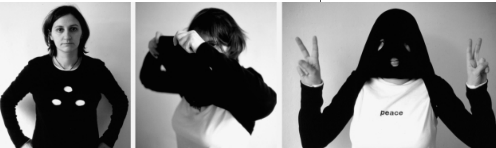
El último grito "The evolution will not be televised" 2001 Camiseta para protestar sin ser identificado.

Ante un mundo donde todo es comercializable y comercializado, algunos diseñadores tratan de resolver la tensión entre una producción ilimitada de objetos, la mayoría de las veces innecesarios, los problemas ecológicos que ello plantea y su tradicional papel social como mediadores entre el usuario y la tecnología. »