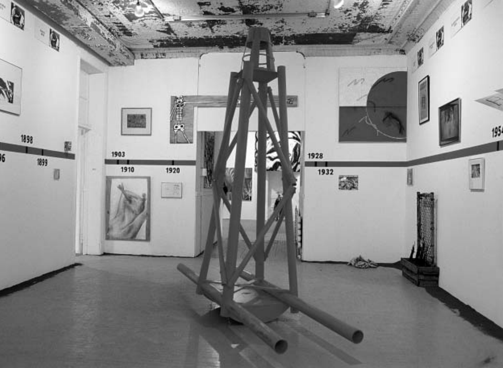
Timeline: A Chronicle of U.S. Intervention in Central and Latin America , Group Material, P.S.1, Long Island City, 1984.

Gazte talde batek beren libidoa proiektatzen duten objektuak (kirol oinetako batzuk, esaterako) bere prezioa du, taldearen antolakuntza egituratzen duena. Nortasun soziala produzitzeko prozesua demokratizatuz joan da, urratsez urrats, masa kontsumoaren ondorioz, zeren eta produktu egoki eta kultur karga dutenak, hala nola walkmanak, kirol oinetakoak, telefono mugikorrak, agendak, e.a. merketuz joan direlako. Prozesu horrek kontsumitzaile hazkunde bat eragiten badu ere, erosketaren ekintza posible egiten duten baldintza kultural eta ekonomikoak beren horretan jarraitzen dute “demokratizazio” mota horretan. Erosketak daukan kultur kargak banakoaren sentiberatasun handiago bat iradokitzen du, eta kultur kontsumoan iristen da gailurra. Haren asmoa da baldintza sozialak gainditzeko promesa faltsuari eustea. Nahiz eta komunikazioaren ordezko kolektiboek, hala nola janzte-kode jakin batzuk, parte-hartzaileen estatus soziala