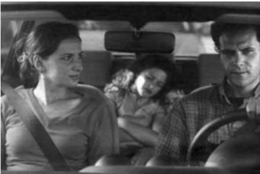
Gerardo Herrero El principio de Arquímedes 2004

ME Lo real trantsizio espainiarraren argazkia da, eta bertan behin baino gehiagotan aipatu izan duzun espazio komuna desagertu egin da, eta bide eman dio aberaste pertsonalari. Eta boterea arrakasta aukerari lotuta geratu da. Zer erlazio ikusten duzu errealitatearen eta fikzioaren artean?