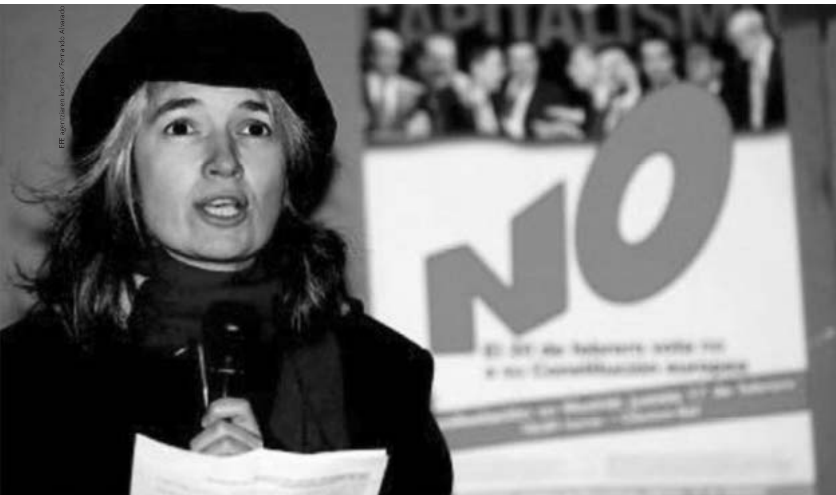
Belén Gopegui, Europako Konstituzioaren kontra Madrilén egin zen manifestazio baten ondoren manifestu bat irakurtzen

ME Zure eleberrri eta filmetan irtenbide banakakoa marrazten da egungo paisaia neoliberalari aurre egiteko aukera moduan. Arrakasta profesionala (sozial zein ekonomikoa) alde batera utzi eta alde ekonomikotik hain “ahaltsua” ez izan arren, berarentzat “aberatsagoa” den bizitza pertsonal baten alde egitea izaten da zure pertsonaia batzuen patua. Haiiek, nola edo hala, beren eraldatze prozesuan, erlatibizatu, are hankaz gora jarri ere, egiten dituzte porrota eta arrakasta sozialaren aukerak. Baina nola utz diezaiokegu daukaguna, eta edukitzeko geratzen zaiguna, desiratzeari?