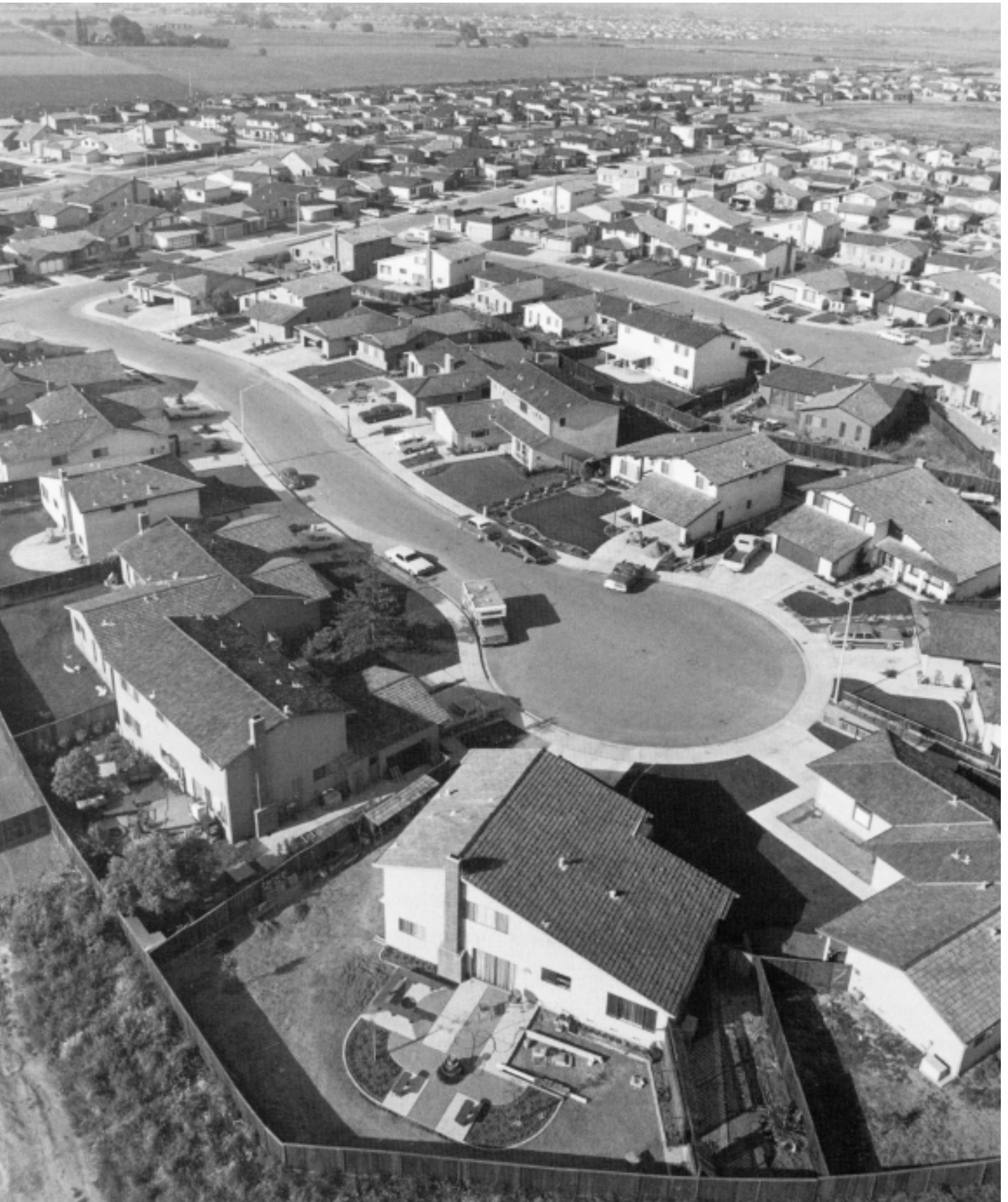
Bill Owens "Suburbia" 1972