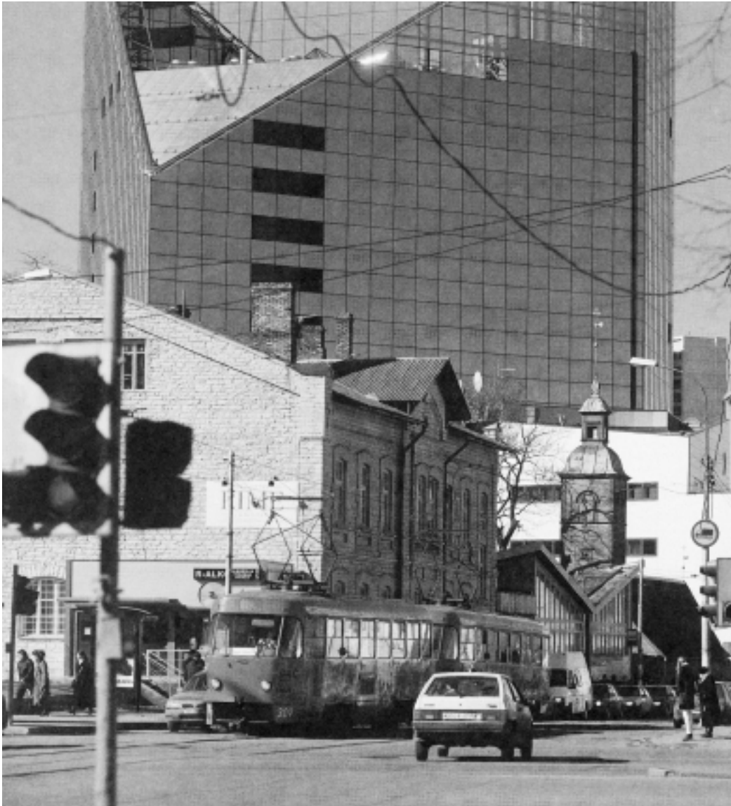
"Simulacrum citi" proiektuaren argazki bat

identitatearen industria espiritu negozioa da