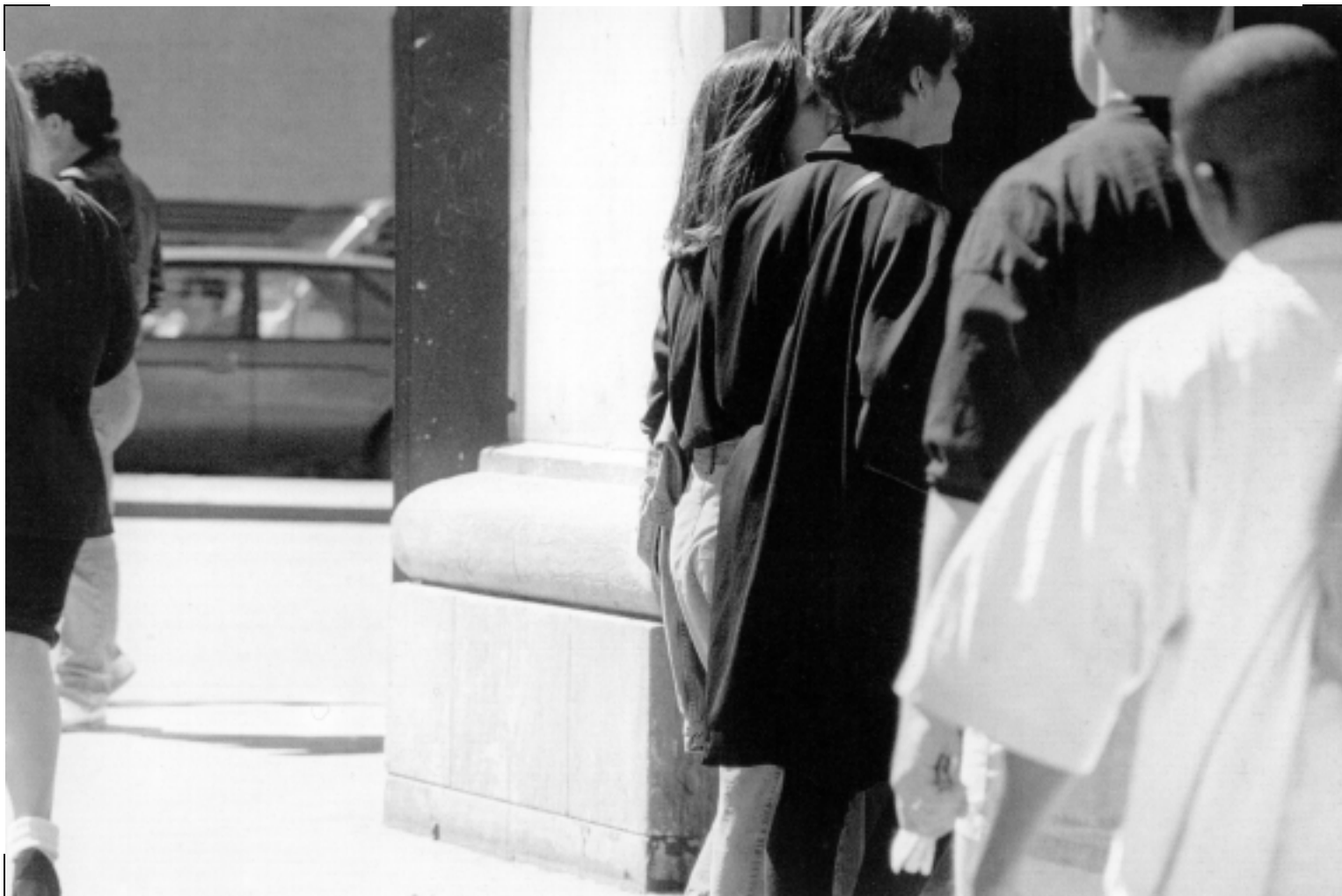
Beat Streuli Sans título, New York 1991

LA cámara QUEDA FIJADA EN UN PUNTO CONCRETO DEL parabrisas O LA VENTANILLA LATERAL DE UN coche EN MARCHA, Y DURANTE LARGOS Y SILENCIOSOS MINUTOS NO PASA NADA POR DELANTE DE LOS ojos DEL ESPECTADOR, SÓLO EL PAISAJE INALTERABLE DE LAS MONTAÑAS DE LA ZONA RURAL DEL KURDISTÁN IRANÍ, LOS monótonos BARRIOS DEL CENTRO DE TEHERÁN O LOS ALREDEDORES CALCINADOS, HIPNÓTICOS Y ABSTRACTOS DE LA CAPITAL.