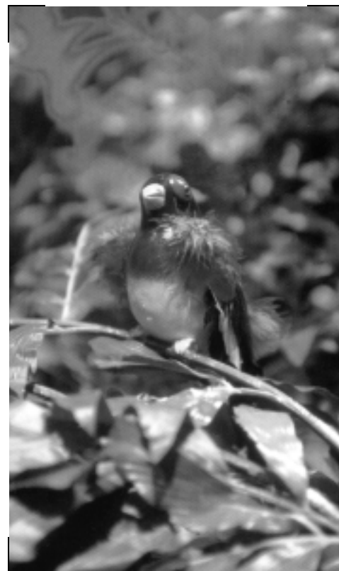
Eduardo Kac. Uirapuru 1999

EDUARDO KAC artista eta Chicagoko The School of the Art Institute -ko Arte eta Teknologiko irakasle elkartua da. Chicagon bizi da.