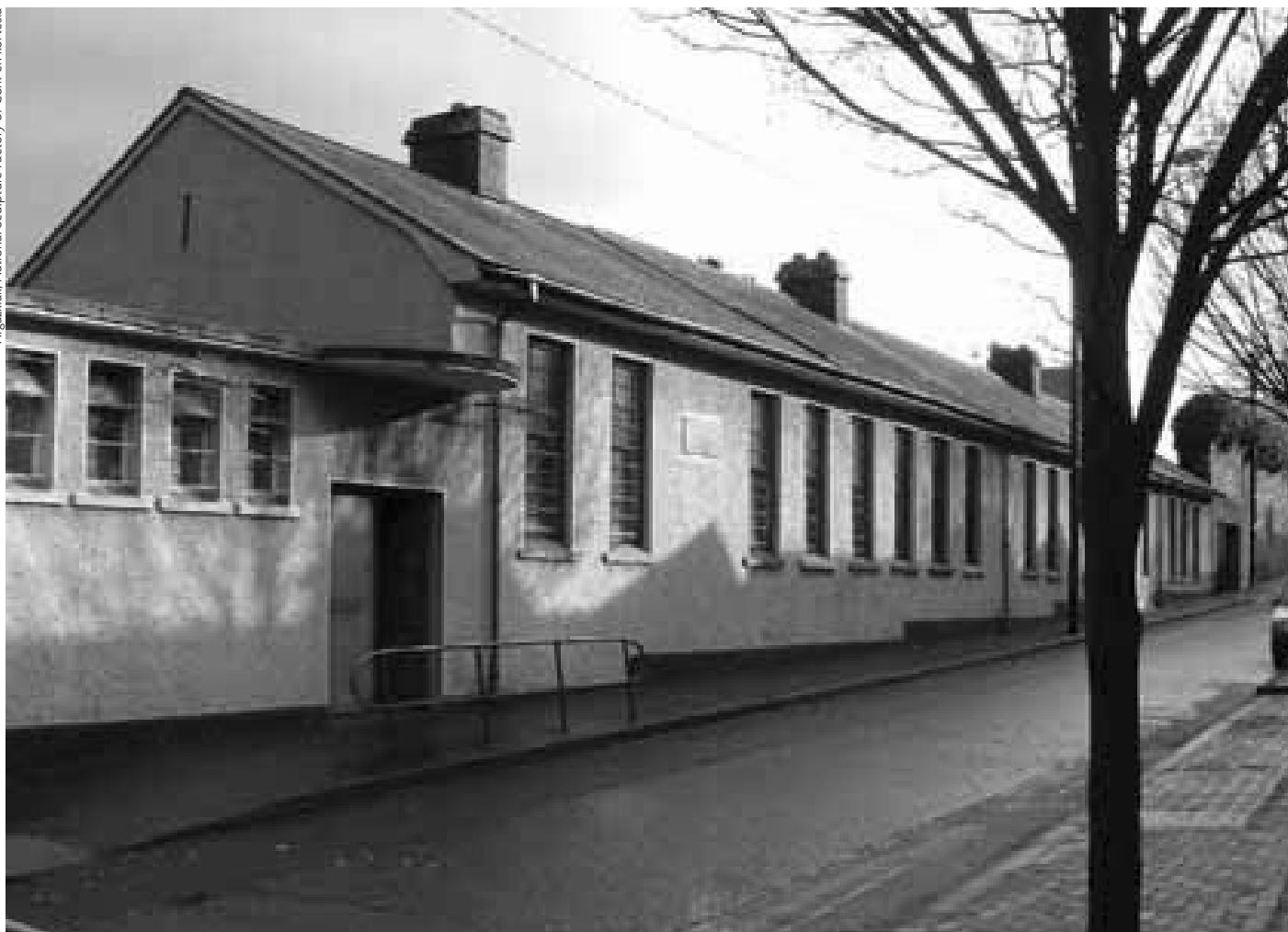
Caucus Centre, Evergreen Street, Cork

inguruko hasierako kontua. Beuysek proposatu zuen Free International University delakoa Dublinen egitea. Ideia horren jatorrian zegoen artistak kultura zeltarekin zuen harreman erromantiko eta mitologikoa. Beuysentzat, Irlanda lurralde birjina zen, garatu gabea oraindik, eta bertan edozein gauza egin zitekeen. Kontzepzio hori okerra da nolabait, baina agerian uzten du artistak kultura hartan zuen interes pertsonala. Guretzat, Irlandan heziketa, demokrazia eta artearen inguruko proiektu bat finkatu nahian genbiltzanez, saihestezina zen adibide horren erreferentzia izatea. Free International University proiektuak hurbildu egiten gintuen lan egin nahi genuen testuinguru zehatzera. Hala ere, ez diogu garrantzi gehiegirik eman nahi izan; gaur egun eredu hura berrasmatzea ez zitzaigun interesatzen, proposamena bera ere izugarri arazotsu ikusten genuelako.