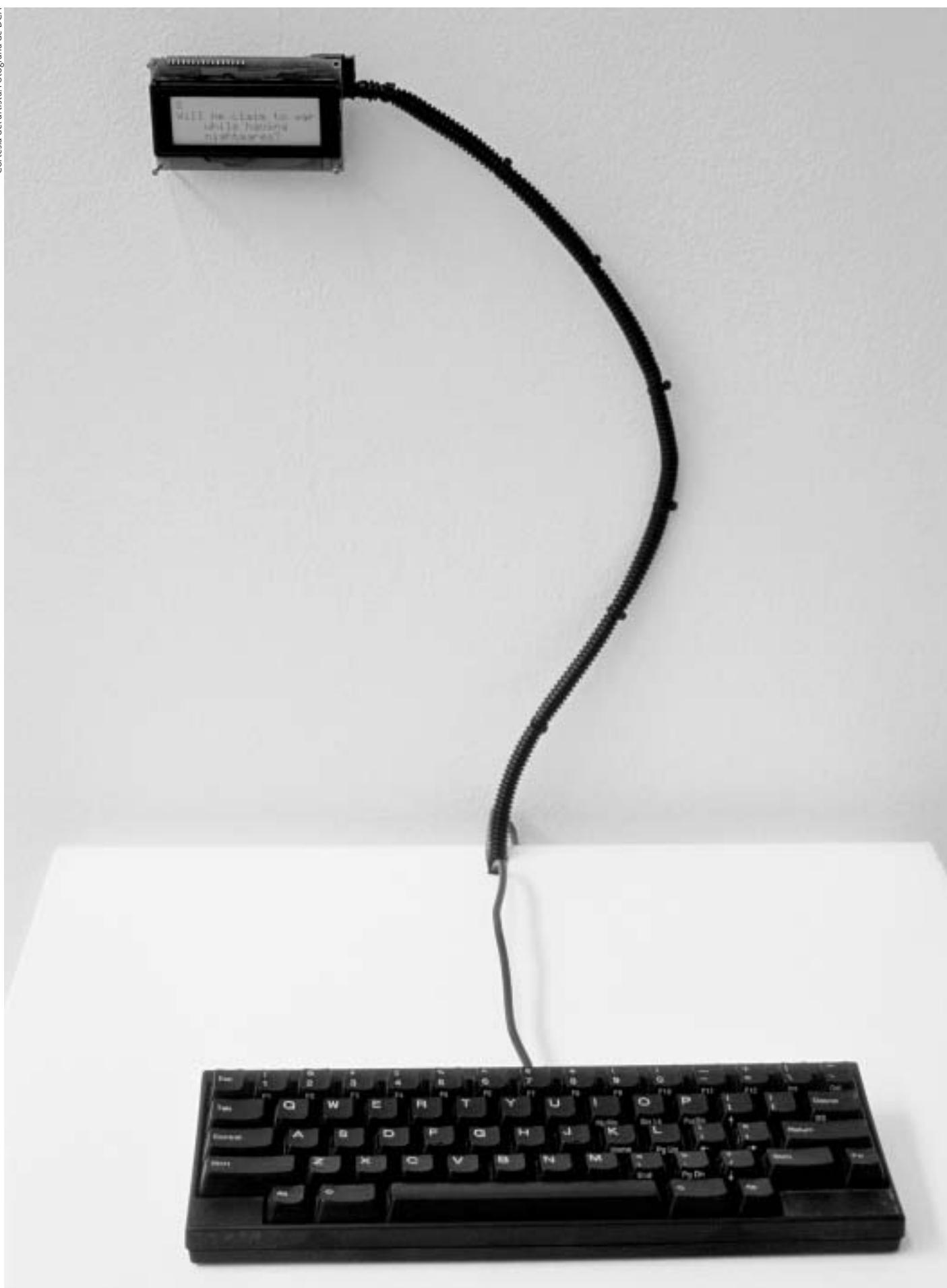
Rafael Lozano-Hemmer 33 Preguntas por Minuto, Arquitectura Relacional 5 2000