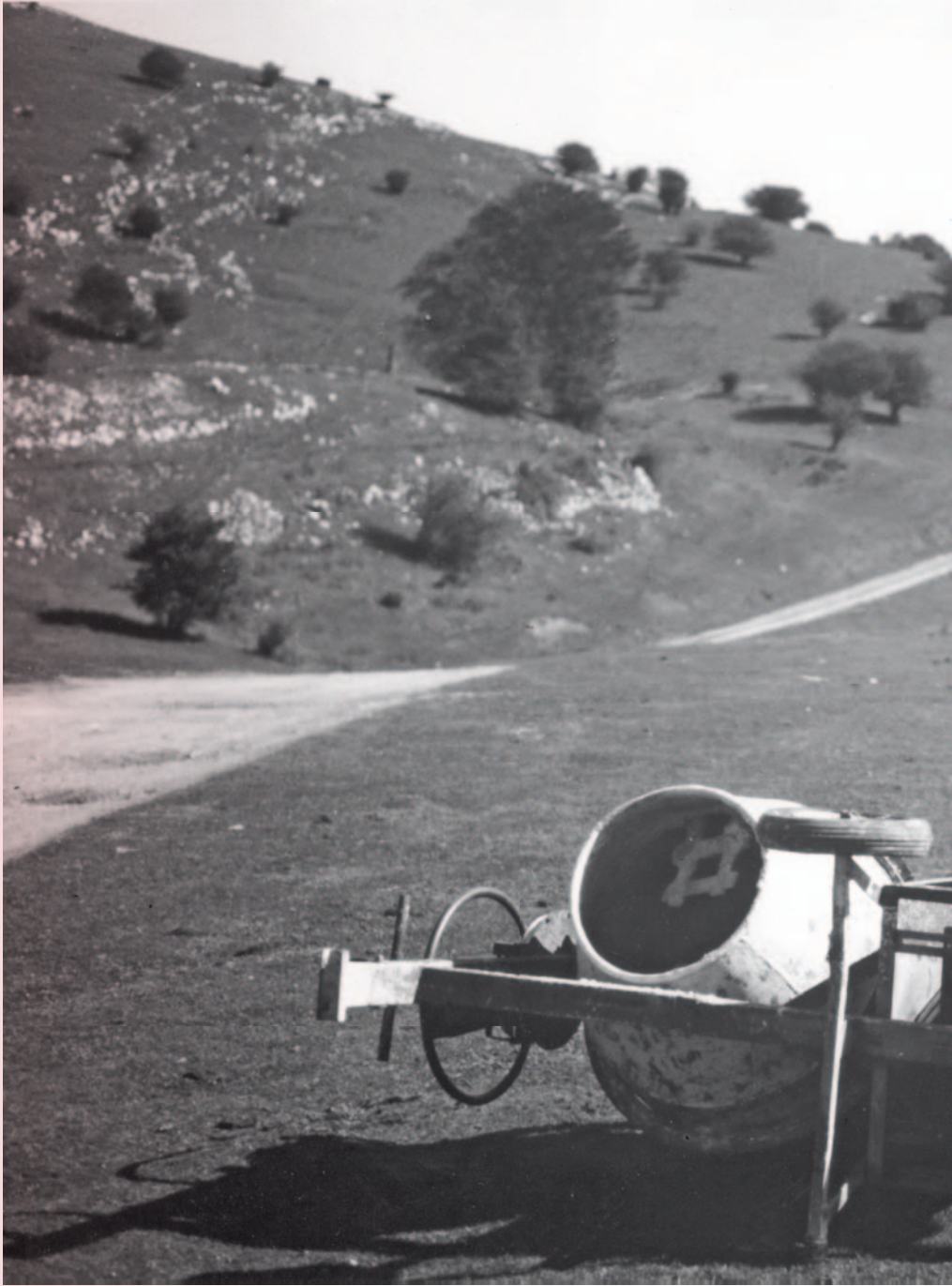
↑ Enirio , Nader Koochaki, 2009.