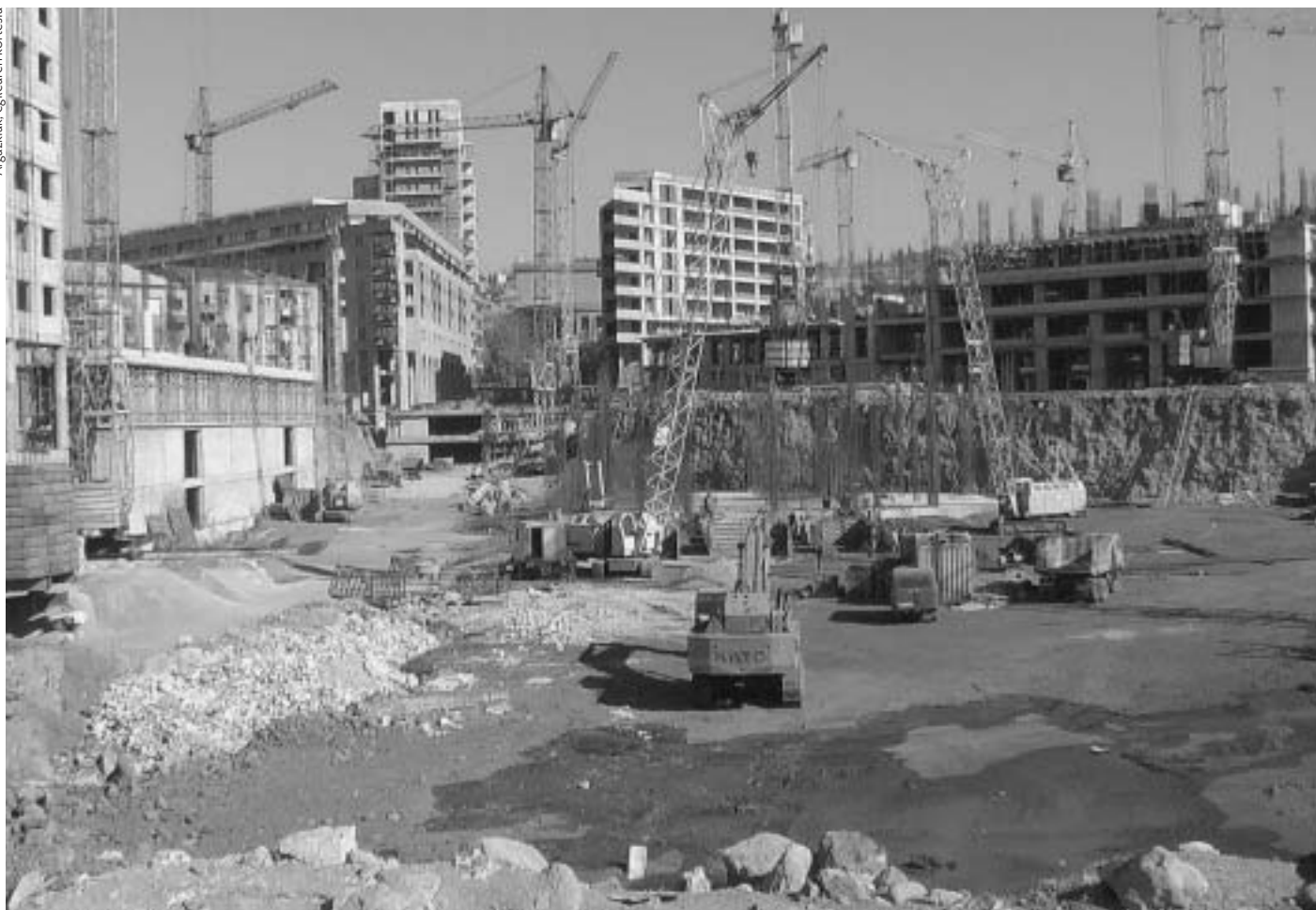
Iparraldeko Hiribidea Hirigintza eta arkitekturaren inguruko ikerketa. 1924an, Alexander Tamanyan-ek, Erevaneko Hiri Plan Orokorren egileak, Iparraldeko Hiribidea eraikitzea proposatu zuen. Operako eraikina Lenin Plazarekin (gaur egun Errepublikaren Plaza) lotuko zuena. Plan hori orain ari da gauzatzen, eta "Iparraldeko" izenak zenbait arazo eta joera soziopolitiko iradokitzen dituen esanahi sinbolikoa hartu du.