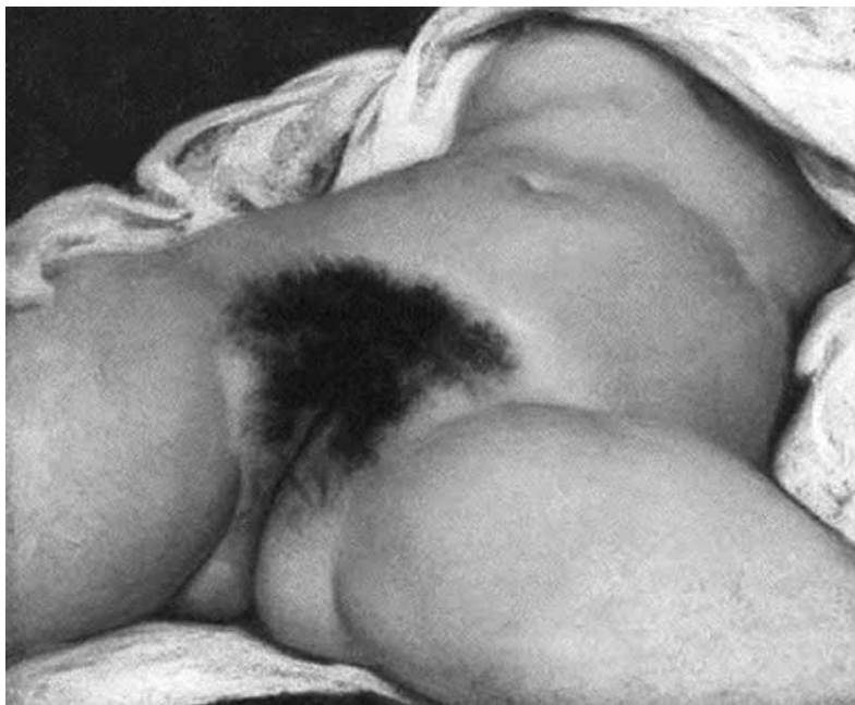
Gustave Courbet L'Origine du monde Oil on canvas, 46 x 55 cm, 1866

identifikazioarekin ultra-ortodoxia baten aurrean gaude: Tanja Ostojiček arte garaikidearen ideologia publikoki esangabea hitzez hitz interpretatu eta muturreraino darama, kapitalismoaren dinamika libidinala artikulatzearen.