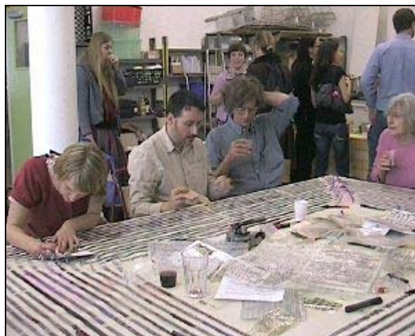
Imagen: Cucinema di Genzano.