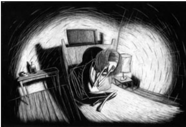
Imagen: "História Trágica com Final Feliz", Regina Pessoa.

[www.ciclopefilmes.com] [www.awn.com/filmografo]