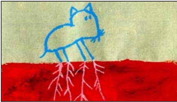
Imagen: "Camouflage", Jonathan Hodgson.

Selección y presentación de cortometrajes a cargo de Erik van Drunen.