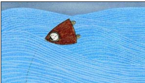
Imagen: "Aukanek", Madina Iskhakova.