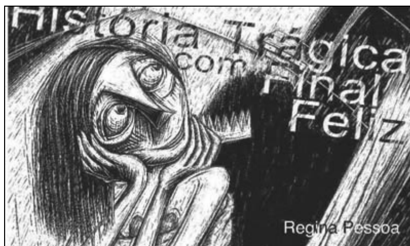
Imagen: “Historia trágica com final feliz”, Regina Pessoa.

[www.ciclopefilmes.com] [www.awn.com/filmografo]