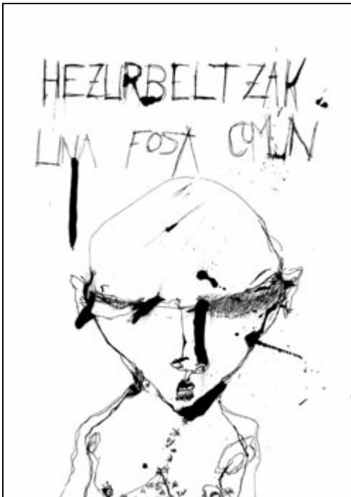
Imagen: "Hezurbeltzak", Izibene Oñederra

Muestra de cortos de animación independiente producidos durante este último año. Selección realizada por Isabel Herguera.