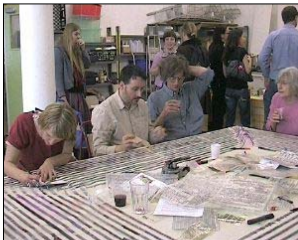
Irudia: Cucinema di Genzano